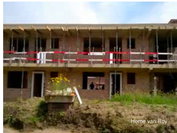
Home van Roy