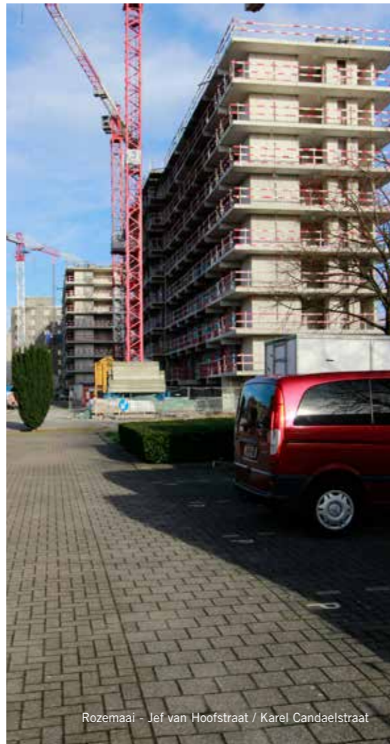
Rozemaai - Jef van Hoofstraat / Karel Candaelstraat