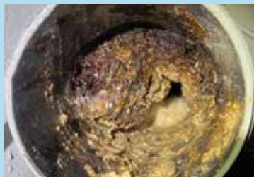
Een beginnende verstopping in een leiding door gestold vet