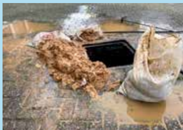
Het opkuisen van vochtige doeken uit een beerput'