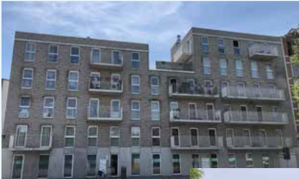
Plantin en Moretuslei - 2018