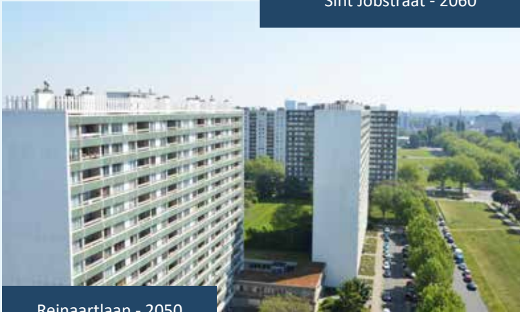
Reinaartlaan - 2050