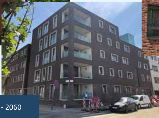
Bredastraat - 2060