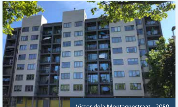
Victor dela Montagnestraat - 2050