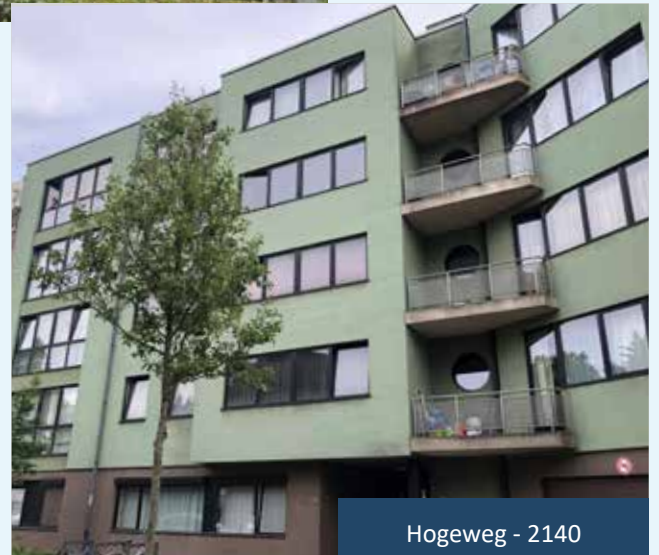
Hogeweg - 2140