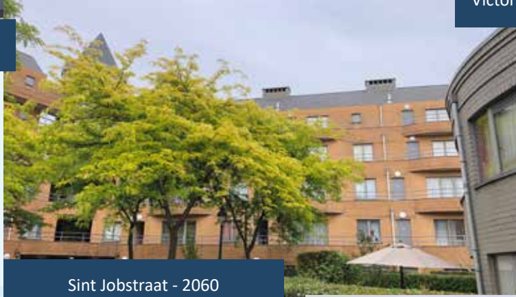
Sint Jobstraat - 2060