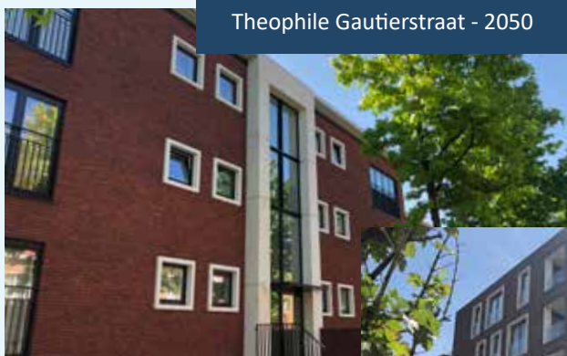
Theophile Gautierstraat - 2050

Op deze pagina's zie je een kleine selectie van onze nieuwe gebouwen in Antwerpen.