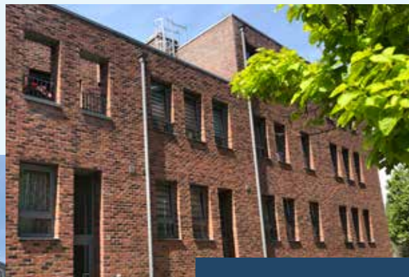
Chocoladegang - 2060